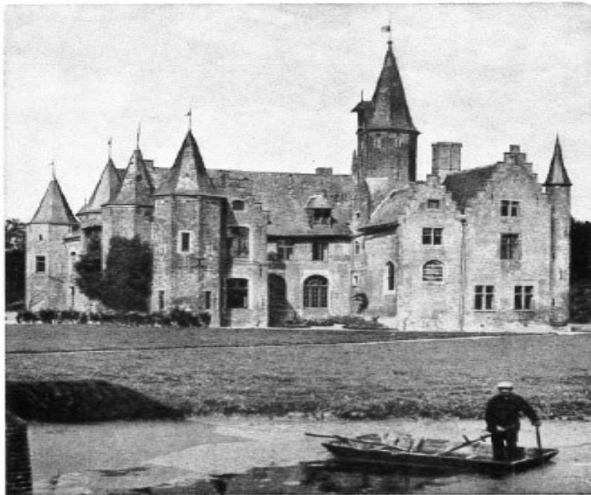
Kasteel van Rumbeke. — Jezuïetennoviciaat 1814-1815.

Hier onderscheidde hij zich door zijn indrukwekkende predicaties en publiek catechismusonderricht. Door zielenijver vervoerd, onderlijnde hij wellicht al te sterk het protest van Mgr. De Broglie tegen de grondwet van Willem I.