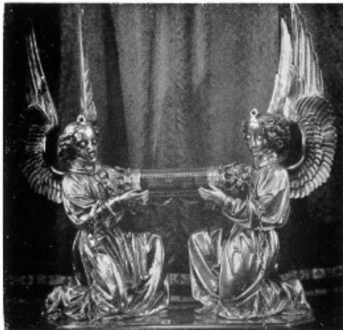
Reliek van het H. Bloed gedragen door gouden engelen in Anstalten omhal met gouden montuur.

Priester gewijd te Keulen in 1795, was hij korte tijd onderpastoor in Sint Gilles te Brugge en in Watervliet. Tijdens de Franse revolutie verrichtte hij wonderen voor Gods Kerk en het Heilig Geloof – redde het relikwie van het Heilig Bloed en oefende als diocesaan missionaris over geheel Vlaanderen – in het geheim – zijn priesterlijke bediening uit.