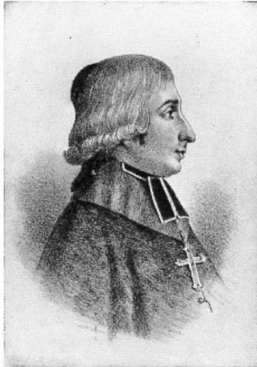
Mgr. Prins de Broglie, Bisschop van Gent 1807-1820.

Door zijn bisschop Mgr. De Broglie aangesteld tot missionaris bleef hij werkzaam in Kortrijk.